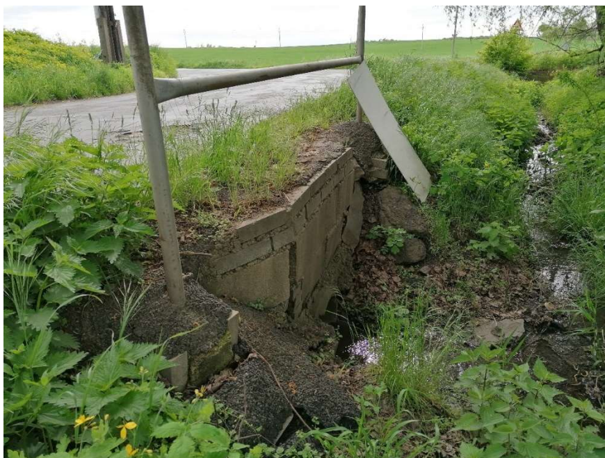
Pohled na výtok

Propustek je tvořen rozpadlými betonovými čely osazenými zrezivělým zábradlím. V rámci opravy komunikace bude propustek obnoven formou ŽB trouby DN 500 délky 7,90m.